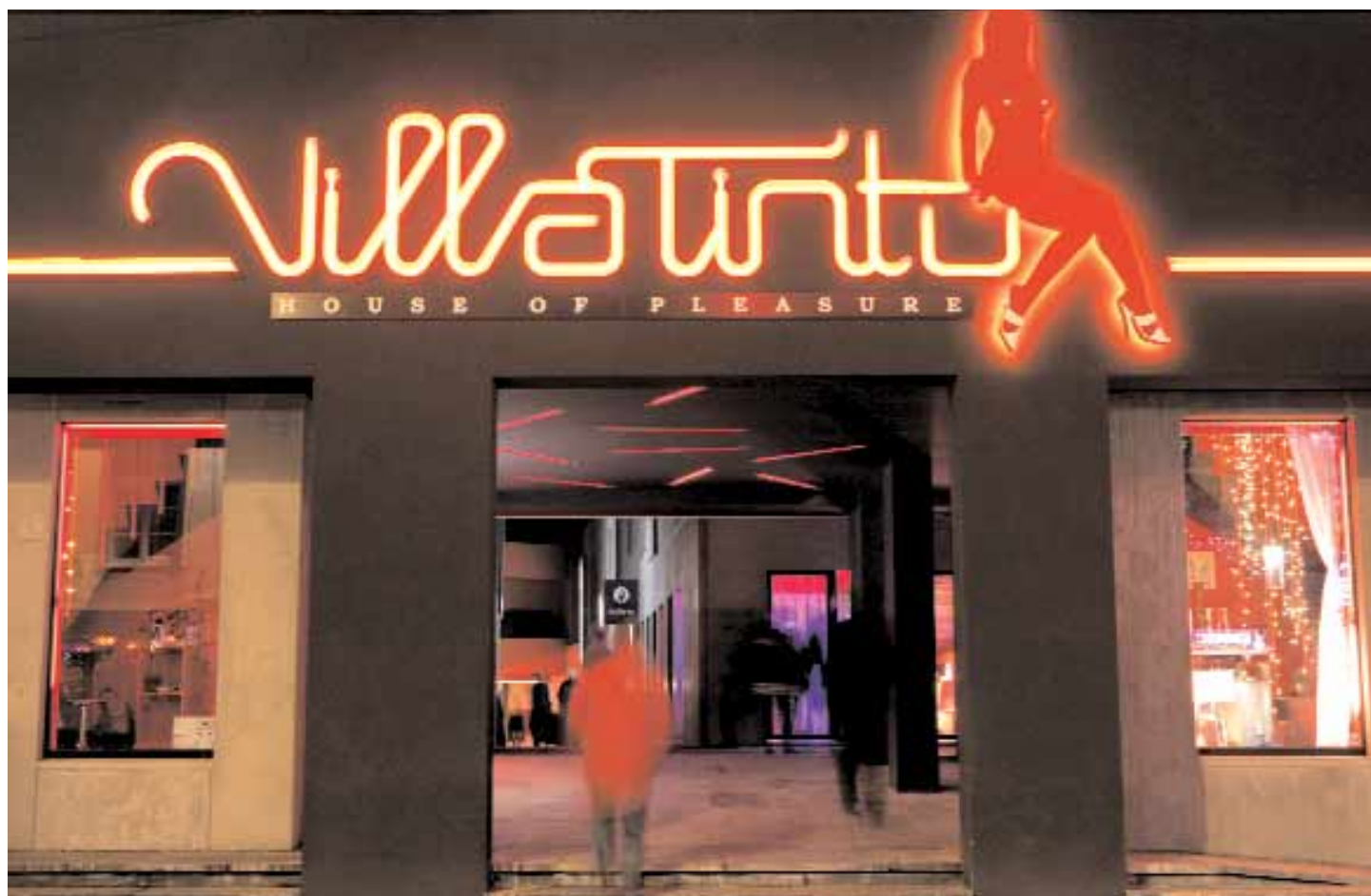
Villa Tinto, en högteknologisk bordell i Antwerpen som Arne Quinze designat.

D et första som fascinerar är mångsidigheten. Arne Quinze designar möbler, lastbilar, skor och installationer. Hans stora projekt till våren är att designa ett helt hotell och han har precis avslutat ett designprojekt som bestod av en 50 meter lång husbåt.