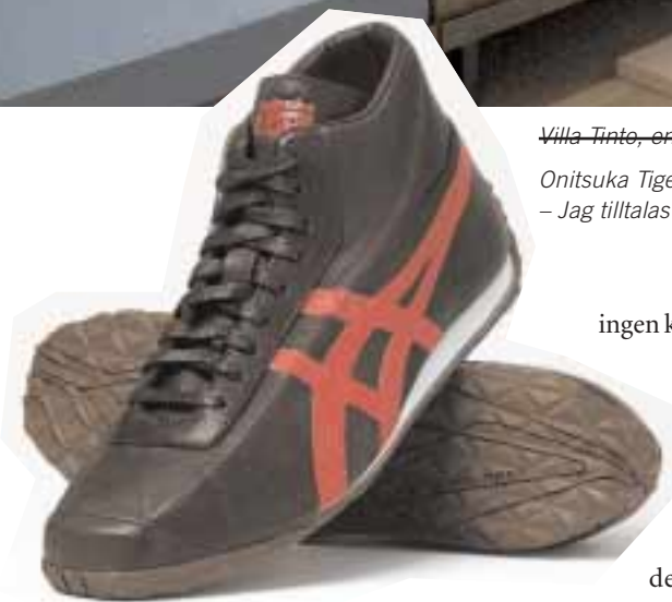
– Jag tilltalas av dynamiken i ett helhetskoncept, säger han.

ingen kunde ta ifrån mig min kreativitet.